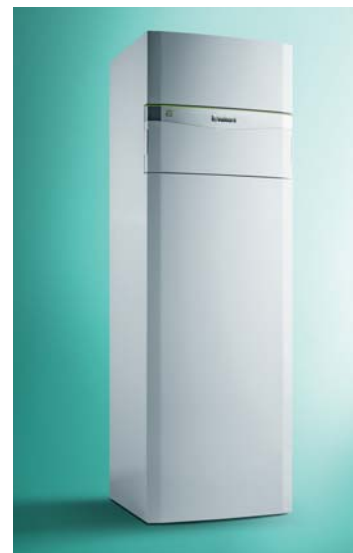
Tepelné čerpadlo flexoCOMPACT exclusive značky Vaillant.

Na vykurovanie, prípravu teplej vody a chladenie, pre novostavby, modernizácie, do klasických i nízkoenergetických rodinných domov sa osvedčilo inteligentné tepelné čerpadlo flexoCOMPACT exclusive s označením Green iQ. Je flexibilné, dokáže totiž využívať každý z alternatívnych prírodných zdrojov tepla – zem, vodu alebo vzduch. Závisí len od majiteľa rodinného domu, pre aký zdroj sa rozhodne. Zariadenie flexoCOMPACT exclusive vzduch/voda získalo na veľtrhu Aquatherm Nitra 2017 zlatú medailu za vysokú účinnosť (trieda A++/A+++)