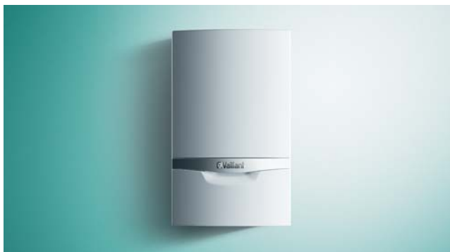
Závesné tepelné čerpadlo geoTHERM 3 kW typu zem/voda.

Malé, priestorovo úsporné riešenie, ktoré prináša maximum komfortu – také je monoenergetické závesné tepelné čerpadlo geoTHERM zem/voda značky Vaillant, s výkonom 3 kW. Je vhodné do nízkoenergetických a pasívnych domov, klasických rodinných