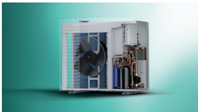
Rez tepelným čerpadlom aroTHERM vzduch/voda.

teplej vody). Systém sa osvedčil nielen v novostavbách, ale aj na vykurovanie existujúcich budov, čo umožňuje výstupnú teplotu až 63 °C. Kľúčovým prvkom je monoblokové tepelné čerpadlo aroTHERM vzduch/voda s výkonom 5, 8, 11 a 15 kW. Využíva obnoviteľný zdroj energie, ktorým je teplo získavané z okolitého vzduchu. Disponuje vysokou energetickou účinnosťou triedy A+/A++. Vďaka inovatívnej konštrukcii, riadeným otáčkam ventilátora