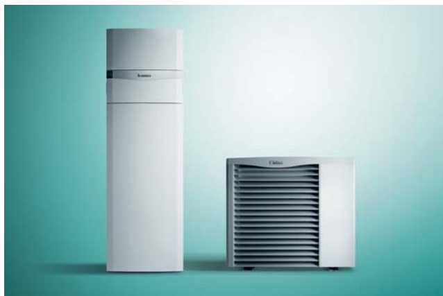
Tepelné čerpadlo aroTHERM s modulom uniTOWER.

Majitelia rodinných domov sa často obávajú, že inštalácia tepelného čerpadla bude priveľmi náročná a diskomfortná pre celú rodinu. Výrobcovia preto zavádzajú také novinky, aby inštaláciu tepelných čerpadiel čo najviac uľahčili. Značka Vaillant preto vyvíja komplexný systém s výnimočne ľahkou montážou. Tvorí ho tepelné čerpadlo aroTHERM vzduch/voda v kombinácii s kompaktným hydraulickým modulom uniTOWER (so zásobníkom