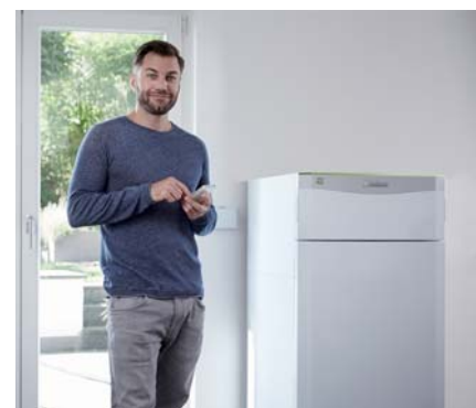
Nové tepelné čerpadlo flexoTHERM exclusive možno ovládať pomocou smartfónu.