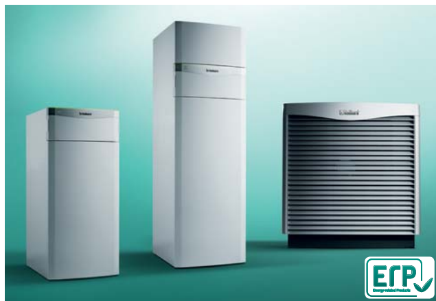
Tepelné čerpadlá flexoTHERM exclusive (vľavo), flexoCOMPACT exclusive (v strede) a ich vonkajšia vzduchová jednotka.

o vykurovaní a o príprave teplej vody v jednom, vhodný je najmä rad tepelných čerpadiel flexoCOMPACT exclusive, ktorý má integrovaný zásobník teplej vody. Tepelné čerpadlá s označením Green iQ možno ovládať pomocou smartfónu, a to vďaka novému systémovému regulátoru multiMATIC 700 a jeho on-line aplikácii.