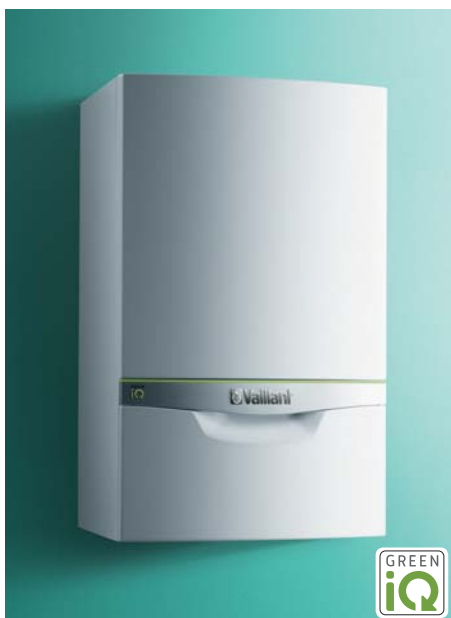
Kondenzačný kotol ecoTEC exclusive s označením Green iQ.

Značka Vaillant preto uvádza na trh prémiové produkty. S označením Green iQ nastavuje najvyššie normy pre trvalo udržateľné tepelné technológie v celej Európe. Toto označenie nesú totiž iba výrobky spĺňajúce prísne smernice. Ich možnosť pripojenia a ovládanie cez internet zároveň odpovedá na to, čo zákazníci v 21. storočí skutočne potrebujú. Domácnosti ocenia najmä praktické bonusy: technológie majú nemeckú kvalitu, nízke prevádzkové náklady, umožňujú Wi-Fi pripojenie a ovládanie na diaľku cez smartfón. Produkty Green iQ majú zároveň mnohé spoľahlivé vlastnosti ako sú najvyššia energetická účinnosť a znížená spotreba energií. Zároveň sú odpoveďou na novú európsku smernicu ErP o energetickej účinnosti. Jedným z jej dopadov je vyradenie veľkej časti nekondenzačných kotlov z výroby a ponuky. Práve najmodernejšie a ekologické kondenzačné kotly budú tie, ktoré v najbližších rokoch nahradia v praxi starú vykurovaciu techniku. V novostavbách sa zároveň otvárajú dvere pre najmodernejšie tepelné čerpadlá. Koncoví užívatelia si prídu na svoje vďaka novým spôsobom nastavenia a regulácie vykurovania, ktoré kráčajú ruka v ruku s dobou.