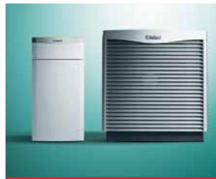
Tepelné čerpadlo flexoTHERM exclusive vzduch/voda s vonkajšou jednotkou aroCOLLECT