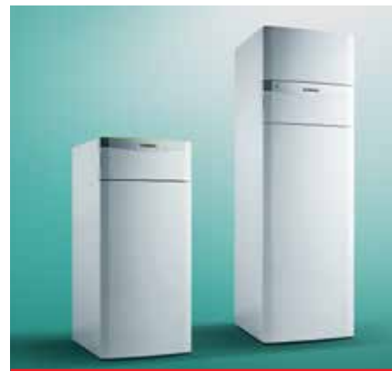
Tepelné čerpadlá Green iQ

Tepelné čerpadlá s označením Green iQ možno ovládať aj na diaľku cez smartfón alebo tablet, a to s ekvitermickým regulátorom multiMATIC 700 a voľne dostupnou aplikáciou multiMATIC. Vďaka regulátoru multiMATIC 700 pracujú zariadenia s vysokou efektívnosťou a môžu dosiahnuť najvyššie triedy energetickej účinnosti A ++ a A +++. Tak