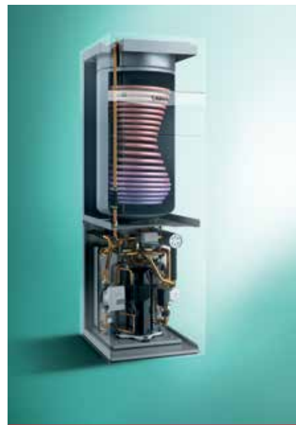
Rez tepelným čerpadlom Green iQ s názvom flexoCOMPACT exclusive

nielenže ušetria peniaze, ale chránia aj životné prostredie. S tepelnými čerpadlami Green iQ môžu domácnosti ušetriť aj prostredníctvom štátneho programu na podporu ekologických zdrojov.