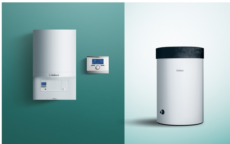
Kotol ecoTEC pro, regulátor calorMATIC 450, zásobník uniSTOR VIH 120