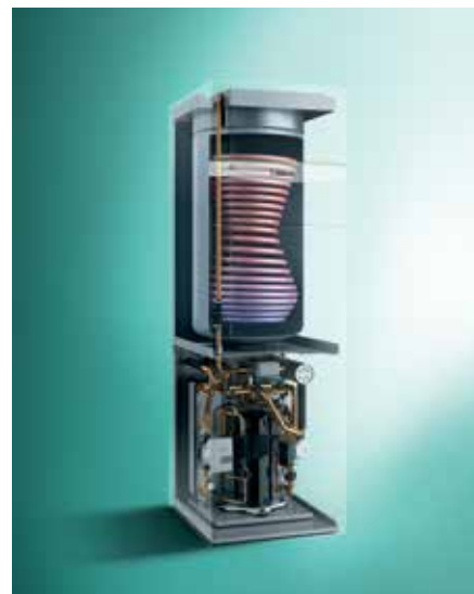
Rez tepelným čerpadlom flexoCOMPACT exclusive