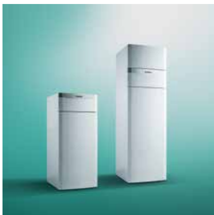
Tepelné čerpadlá Green iQ