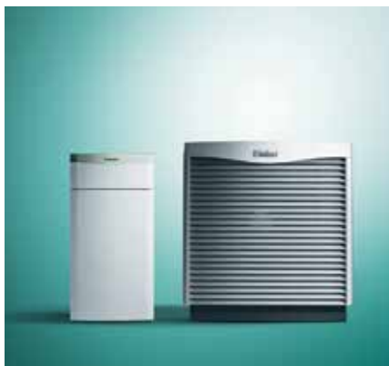
Tepelné čerpadlo flexoTHERM exclusive vzduch/voda s vonkajšou jednotkou aroCOLLECT

Inovatívne a univerzálne tepelné čerpadlá s názvom flexoTHERM exclusive a flexoCOMPACT exclusive s označením Green iQ využívajú flexibilne každý z alternatívnych prírodných zdrojov tepla – zem, vodu alebo vzduch. Životné prostredie totiž môže poskytnúť až 75 % potrebnej energie zadarmo. Tepelné čerpadlá Green iQ sú účinnejšie než podobné zariadenia na trhu. Majú veľmi tichú prevádzku vďaka dôkladnému tlmeniu vibrácií a efektívnej zvukovej izolácii. V súlade s novou európskou smernicou ErP sa zaraďujú do triedy „A++“. Tieto zariadenia majú novovyvinutý vysokoúčinný chladičový okruh, ktorým dosahuje tepelné čerpadlo vyššie COP. Sú ideálne do novostavieb, pri modernizáciách, do rodinných aj menších bytových domov. Možno ich inštalovať rýchlo a ľahko do technickej miestnosti, ale aj kdekoľvek do domu. Ich konštrukcia pozostáva z kvalitných a recyklovateľných materiálov.