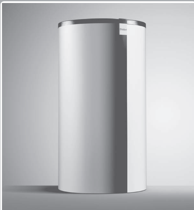
Akumulačný zásobník aIISTOR